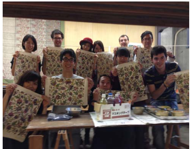
(和服專門店二葉苑)